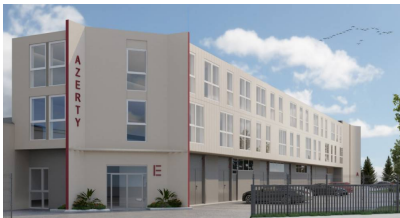
Perspective du projet Ampère Village situé à Pontoise dans le Val-d'Oise.

Île-de-France Investissements et Territoires , SEM patrimoniale de la Région Île-de-France , s'est associée en co-investisseur minoritaire à la foncière Soremi pour l'acquisition du parc d'activités Ampère Village situé à Pontoise, dans le Val-d'Oise.